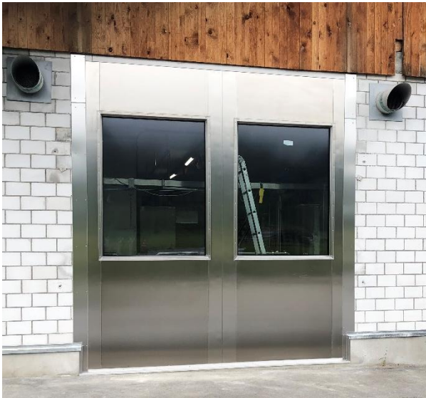
Die Wand ist wieder verschlossen