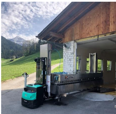
Ausbau der alten Presse

Der einzige Weg für so ein grosses Gerät geht mitten durch die Wand