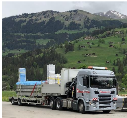
Lieferung der neuen Presse