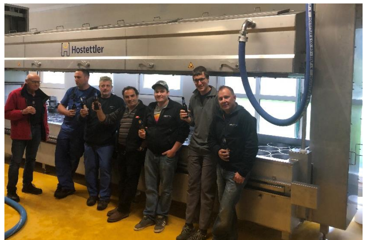
Unser «Zügelteam» hat sich das Bier verdient